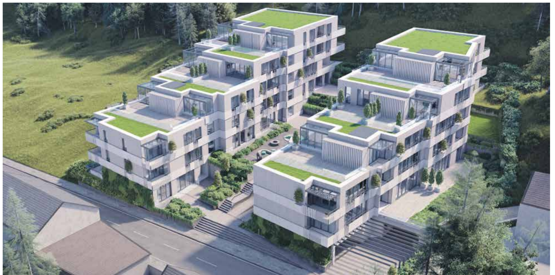
Na Hradeckega cesti so zasnovali projekt Devana park s 47 prestižnimi stanovanji.

Gradnja luksuznih stanovanj se je že začela tudi pod Golovcem, natančneje na Hradeckega cesti, kjer so zasnovali projekt Devana park. »Gre za 47 prestižnih stanovanj v dveh lamelah, ki sta zasnovani kot terasasta bloka. Investitorica je ljubljanska družba Rezona, vrednost investicije znaša okoli devet milijonov evrov,« pojasnjuje Đukić. Na tem območju trenutno potekajo zemeljska dela, stanovanja bodo predvidoma vseljiva konec poletja prihodnje leto. In kakšne bodo cene? Đukić pravi, da bodo povprečne cene za kvadratni meter od 3100 evrov (brez DDV) oziroma 3782 evrov (z DDV) naprej. Za okoli 70 kvadratnih metrov veliko stanovanje (brez dveh parkirnih mest