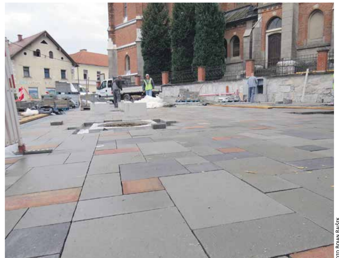
Gradbinci hitijo z ureditvijo Staretovega trga, na katerem bo stal spomenik Davorinu Hostniku.

Delo d.o.o., Dunajska 5, SI 1509 Ljubljana, 1013946