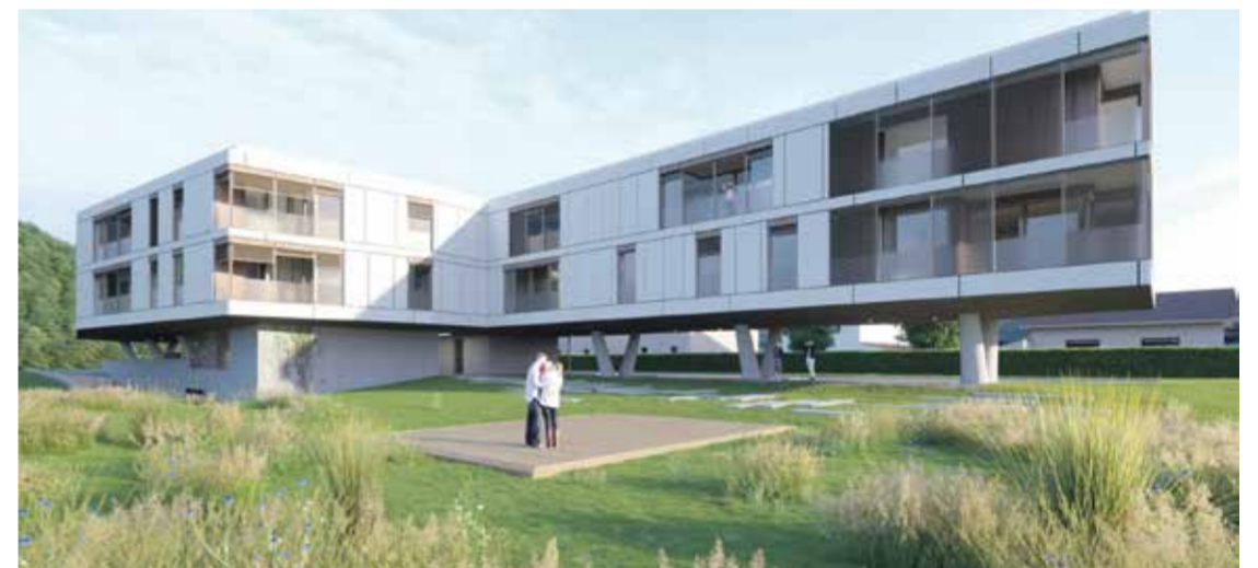
Posebnost projekta Vila Ekorna na Lavrici je, da gre za leseno gradnjo v štirih etažah.

»Nepremičninski trg v Ljubljani še zdaleč ne prenese tolikšnega števila luksuznih stanovanj. Po